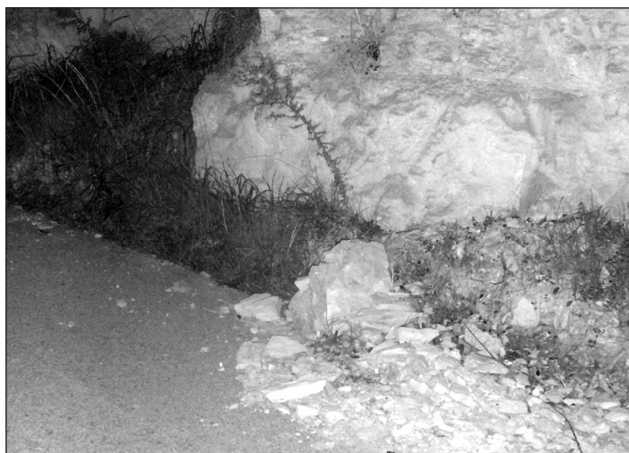
Eslavissades perilloses al passatge del Serrat: cal fixar les roques per evitar accidents!