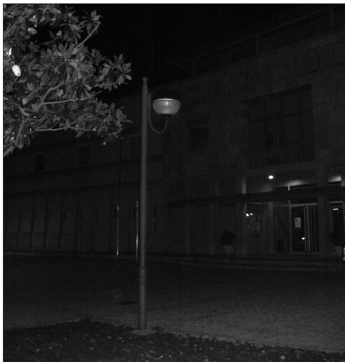
Farola fosa a la Plaça 11 de Setembre des de fa 2 mesos: tant costa canviar una bombeta?